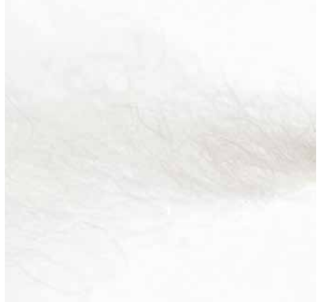
Klassisch getrocknete Textilfaser.

werden auf diese Weise beseitigt. Der angenehme Nebeneffekt: Die Wäsche fühlt sich sensationell weich an und wirkt frisch. Selbst unangenehme Essens- oder Tabakgerüche werden durch den Luftionisator wirkungsvoll entfernt. Ion Tech Technologie gibt es nur beim Modell D7664 N.