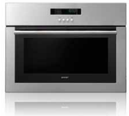
GCS 131 X