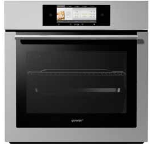
GO 896 X

Gorenje+ Abzugshauben stehen mit moderner Lüftungstechnologie für höchste Effizienz und geräuscharmen Betrieb. Boost+ sorgt für einen zusätzlichen Leistungsschub – der intensive Luftzug schaltet sich nach ein paar Minuten von selbst wieder ab. Mit der modernsten Filtertechnologie