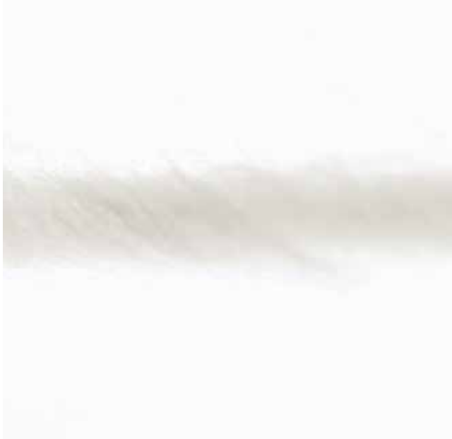
Mit IonTech-Technologie getrocknete Textilfaser.

Für die effektive Glättung von Fasern und Falten sorgt die innovative IonTech Technologie. Auch statische Aufladungen, die während des Trockenvorgangs entstehen,