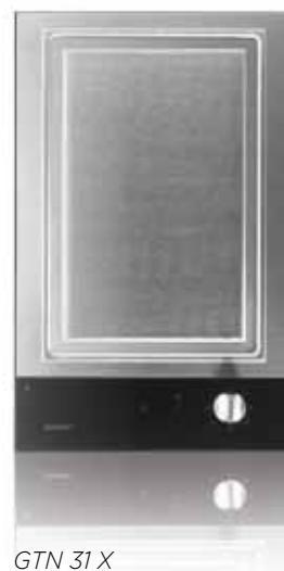
GTN 31 X

im P.A.S.+ System. erfolgt die Luftabsaugung hier auch an den Seiten. Dies führt zu geringerem Stromverbrauch und leiserem Betriebsgeräusch bei gleichzeitig höherem Effizienzgrad in der Luftabsaugung. Refresh+ sorgt dafür, dass sich die Abzugshaube einmal pro Stunde automatisch einschaltet und dann für fünf Minuten läuft, um die Innenraum-Luft zu reinigen.