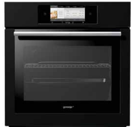
GO 896 B