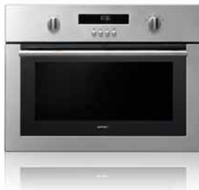
GCM 131 X