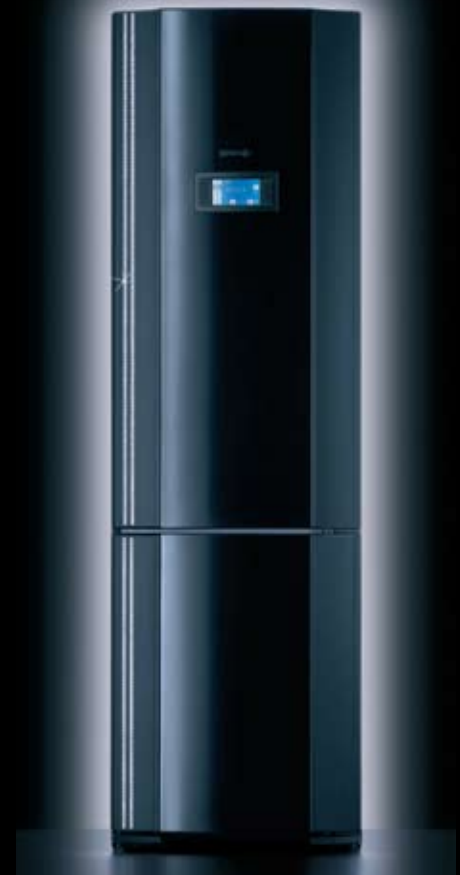
Kühl-Gefrier-Kombination NRK 67358 SB