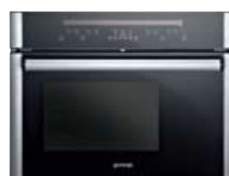
Kompaktbackofen mit Dampfgarer