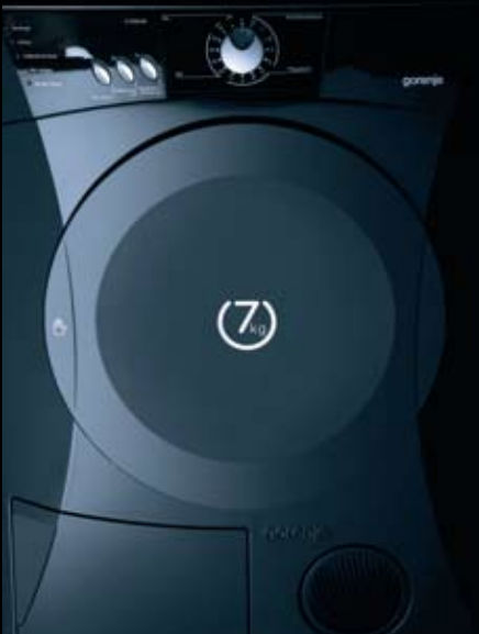
Kondensationstrockner D 72325 BK

sorgt auch hier für optimale Prozess-Steuerung und -überwachung. Ein Feuchtesensor, der sich im Inneren der Trommel unterhalb des Bullauges befindet, stoppt automatisch den Prozess, sobald einer der gewünschten Trockengrade erreicht ist. Für alle, die nicht gerne bügeln, gibt es die Funktion Knitterschutz.