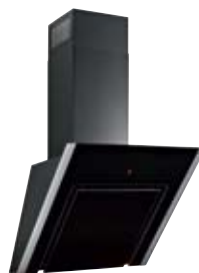
PURE Line DVGA 8545 AX