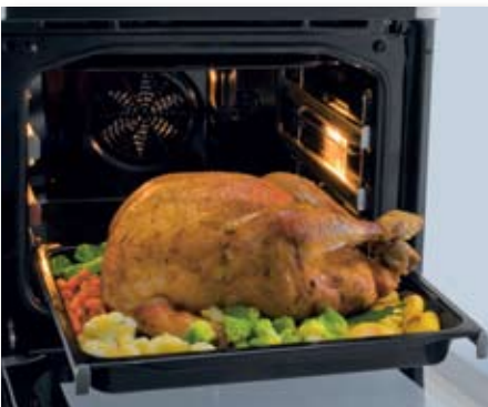
Viel Platz, super große Backflächen

Der Backofen mit seinem außergewöhnlichen Design verfügt über ein XXL Volumen von bis zu 65 Litern und bietet eine der größten Backflächen . Die innovative Grilllösung mit getrennt schaltbarem Singlegrill , super schneller Aufheizzeit von nur 6 Minuten oder kühle Backofenumgebung und Backofentür sind nur einige der vielen Besonderheiten der neuen Generation Backöfen und Herde von Gorenje.