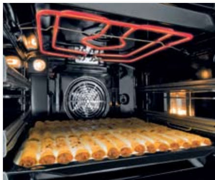
Getrennt schaltbare Grills sparen Energie bei der Zubereitung kleiner Speisen