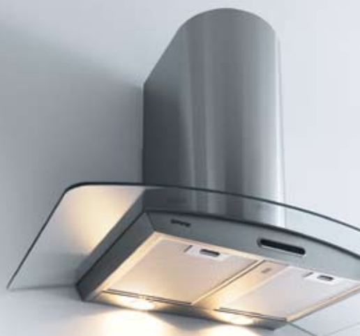
Sensorgesteuert DKG 9715 E

Die Dunstabzugshaube avanciert in der Designerküche zum Blickfang. Aber nur schön sein genügt nicht, moderne Dunstabzugshauben müssen auch leistungsstark sein. Ein weiteres wichtiges Merkmal ist die Geräusentwicklung. Die Super Silent Modelle von Gorenje arbeiten flüsterleise. Besonders attraktiv ausgestattet sind die Topmodelle von Gorenje, die sich sensorgesteuert aktivieren , sobald Temperatur oder Luftfeuchtigkeit in der Küche ansteigen. Die Absaugleistung wird dabei den jeweiligen Bedingungen angepasst und die Lüfter schalten sich automatisch an oder ab . Dadurch wird die Motorleistung optimal genutzt, um frische und saubere Luft zu erzeugen.