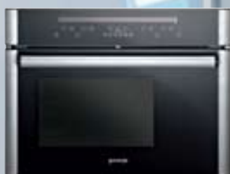
BOC 6322 AX

Kompakt-Dampfbacköfen überzeugen nicht nur durch ihre hohe Funktionalität. Trotz kompakter Abmessungen von nur 45 cm Höhe bieten sie ein Garraum-Volumen von 27 Litern. Das Touch Control Display macht die Bedienung komfortabel und einfach. Der Backofen ist dank vorprogrammierter professioneller Kochvorschläge auch für alle, die wenig Erfahrung haben prädestiniert und sorgt für perfekte Ergebnisse.