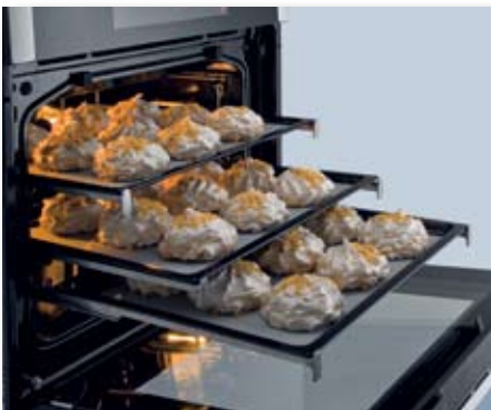
Vollausziehbare Teleskopauszüge (Zubehör) und Backen auf mehreren Ebenen gleichzeitig

Nach dem Einschalten des Backofens einfach nur das gewünschte Gericht, das per Symbol angezeigt wird, antippen und die Starttaste drücken. Einige hinterlegte Programme definieren automatisch die dafür erforderlichen Einstellungen der Backofenfunktion sowie Temperatur und Zeit . Große und klar erkennbare Symbole machen die Bedienung kinderleicht. Auf Wunsch sind selbstverständlich alle Funktionen auch manuell einstellbar. Bevorzugte Einstellungen sind speicherbar und beim nächsten Mal einfach abrufbar.