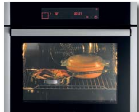
Funktion Warmhalten hält Gerichte auf Wunschtemperatur