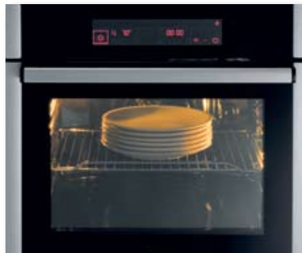
Funktion Tellerwärmen für professionellen Service