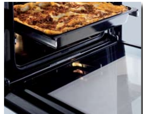
Vollglas-Innentür für einfache Reinigung