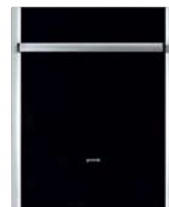
Dekorpanel für Geschirrspüler