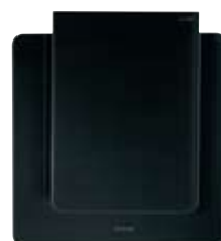
Gorenje Design- linie Ora-İto DKG 552 ORA-S

Das Design der Gorenje Dunstabzugshauben wird Sie beeindrucken und Ihrer Küche neuen Glanz verleihen.