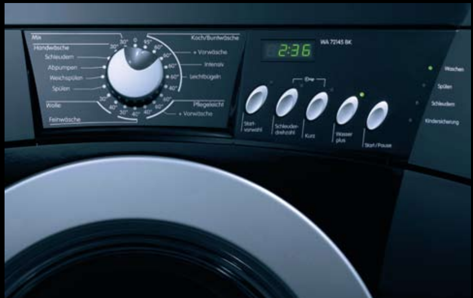
Waschvollautomat WA 72145 BK

NO FROST, Nutzinhalt von 320 Litern und Energie-Effizienzklasse A+ sind charakteristische Merkmale der Kühl-Gefrier-Kombination NRK 67358 SB. Das baugleiche Modell RK 67365 SB gewann 2007 den Plus X Award in der Kategorie Bedienkomfort. Das neue BlackUp Modell ist auf der Frontseite ebenfalls mit CRYSTALLIZED™ - Swarovski Elements verziert und die neue Innenausstattung macht dieses Modell noch attraktiver. Mit dem zentral positionierten interaktivem Touchscreen-Display können per Fingertipp eine Vielzahl von Funktionalitäten, wie beispielsweise der Radio und eine Rezeptliste, abgerufen werden. Weitere Highlights sind das Multiflow Kühlsystem, innovative Türausstattung, herausnehmbare