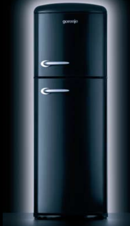
Retro Kühl-Gefrier-Kombination RF 62309 BK

teils beträgt 229 Liter, im Gefrierteil kommen noch einmal 65 Liter dazu. Noch mehr Authentizität im Stil der 50iger Jahre verleiht den Geräten das bombierte Frontdesign und die dreidimensionalen Logobuchstaben.