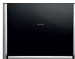
Dekorpanel für Mikrowellen