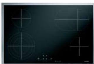
Glaskeramik-Kochfeld 75 cm