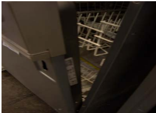
Geschirrspüler im Türrahmen rechts