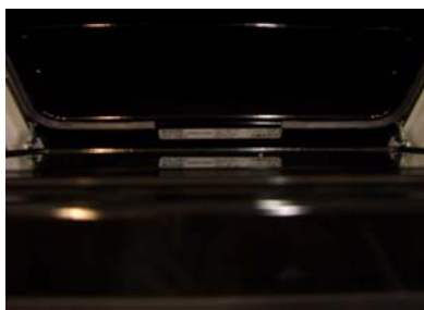
Bei Elektroherde finden Sie das Typenschild entweder bei geöffneter Türe im Backofenrahmen oder